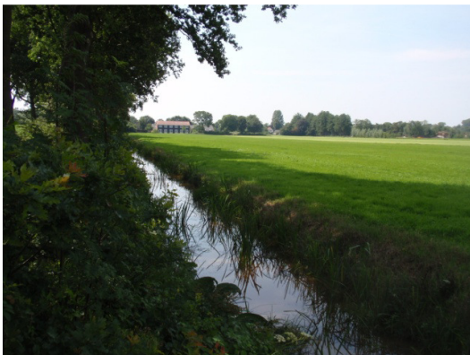
Blik vanaf het Prinsenlaantje naar het zuiden, richting Koningsbed.

Wij willen benadrukken: voor onze stichting staat maar één ding voorop: dat ook in de verre toekomst het natuurplan gehandhaafd blijft, en dat het Prinsenlaantje ongemoeid wordt gelaten en beschouwd blijft als natuurgebied.